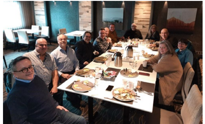
Premières retrouvailles, le 25 novembre 2023